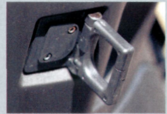
Gepäckhaken für Taschen