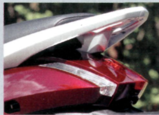
Gepäckträger in Serie