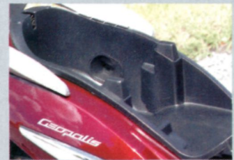
Nur für flache Mütchen

kein Integralhelm, das Handschuhfach ist zwar hoch, aber viel zu flach. Ein zusätzliches Topcase ist ratsam.