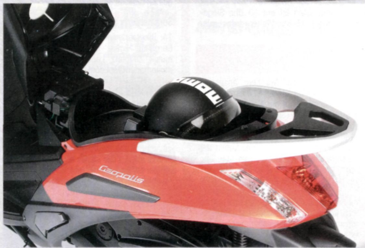
Im Helmloch unter der Sitzbank ist Platz für zwei Jet-Helme.